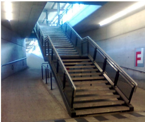
Das Bild zeigt Treppe und dahinter liegende Rampe von der Unterführung aus. Die oberen Ausgänge liegen am Bahnsteig hintereinander, dadurch ist zwischen Aufgang und Bahnsteigkante viel Platz. (Bahnhof Chur)